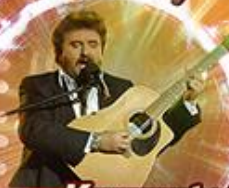
Krzysztof KRAWCZYK niedziela 20 00