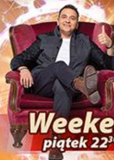
Weekend piątek 22 30