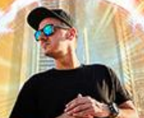
C-BooL sobota 23 00