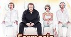
Formacja Nieżywych Schabuff sobota 21 30