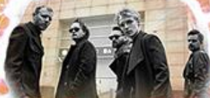
LemON piątek 21 00