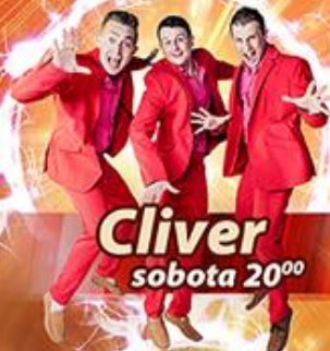
Cliver sobota 20 00